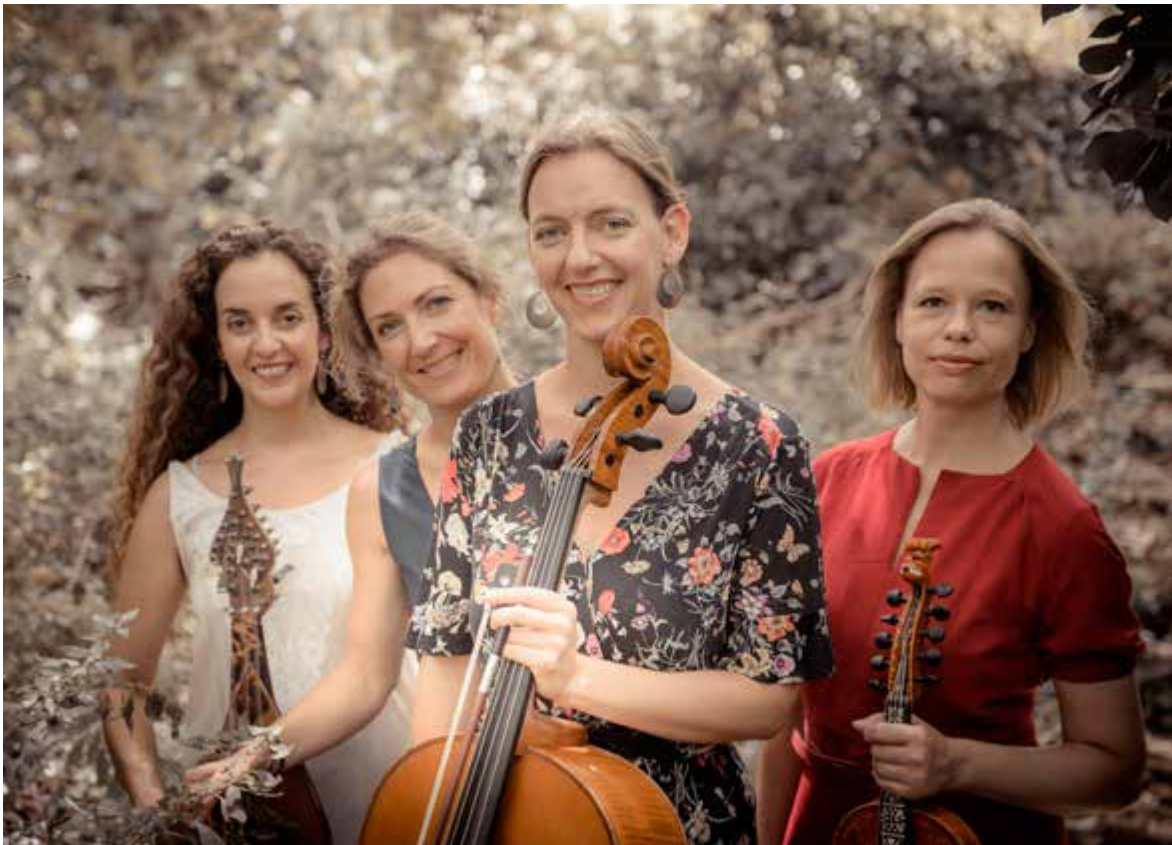
Strykekvartetten Tokso er ute med nok et strålende album.