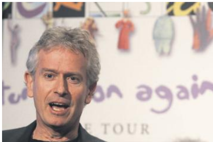
Det er ikke mye spor etter Genesis i bandets keyboardist Tony Banks andre klassiske orkesteralbum.

musikken han laget til Ringenes herre. Hobbitten Frodo kunne godt ha skuert ut over landskapet til City Of Gold til Banks symfoniske stykker. Dessuten er det enkeltpartier som er in-